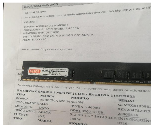
Memoria: Marca DATO modelo: DDR4 SERIAL No. 23060514

Sin embargo, se evidencia que no se está llevando a cabo, un adecuado control a los repuestos que han sido instalados en los diferentes equipos, debido a que al realizar la auditoria no se tenía certeza por parte del personal de sistemas y comunicaciones en donde se encontraban algunos repuestos que les fueron solicitados por el equipo auditor.