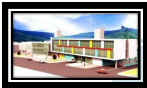
Ilustración 2. Hospital Santa Monica.

El hospital ofrecerá los servicios de consulta médica general, odontología, urgencias, laboratorio, hospitalización, maternidad, cirugía ambulatoria, radiología, consulta médica especializada y cirugía. El Santa Mónica hace parte de un programa conocido como Fortalecimiento de la Red de Salud de la Subregión Centro, que comenzó en 2014 con los municipios de Tangua, Yacuanquer y Pasto.