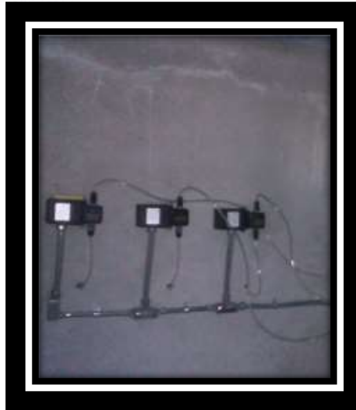
Ilustración 1 Bomba Dosificadora